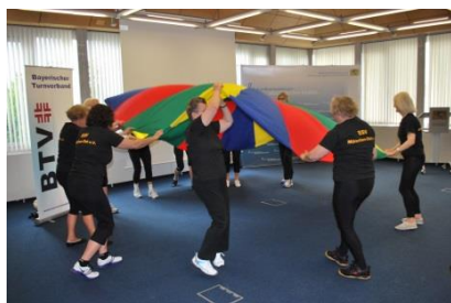
Sport mit Älteren

Die Inhalte der Ausbildung bieten einen Einblick in das vielfältige Angebot des Bayerischen Turnverbandes.