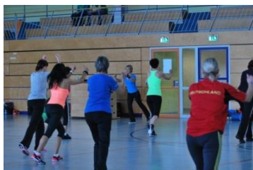
Fitness und Aerobic